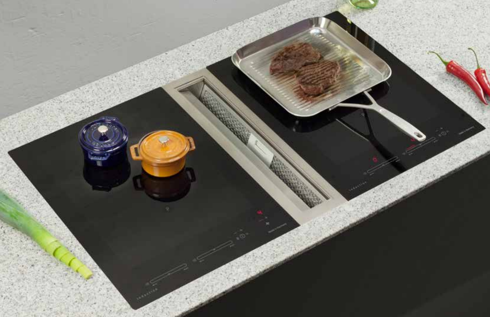
Flächeninduktion CRF 382 O2 mit URS Mulden-Lüfter 45-520